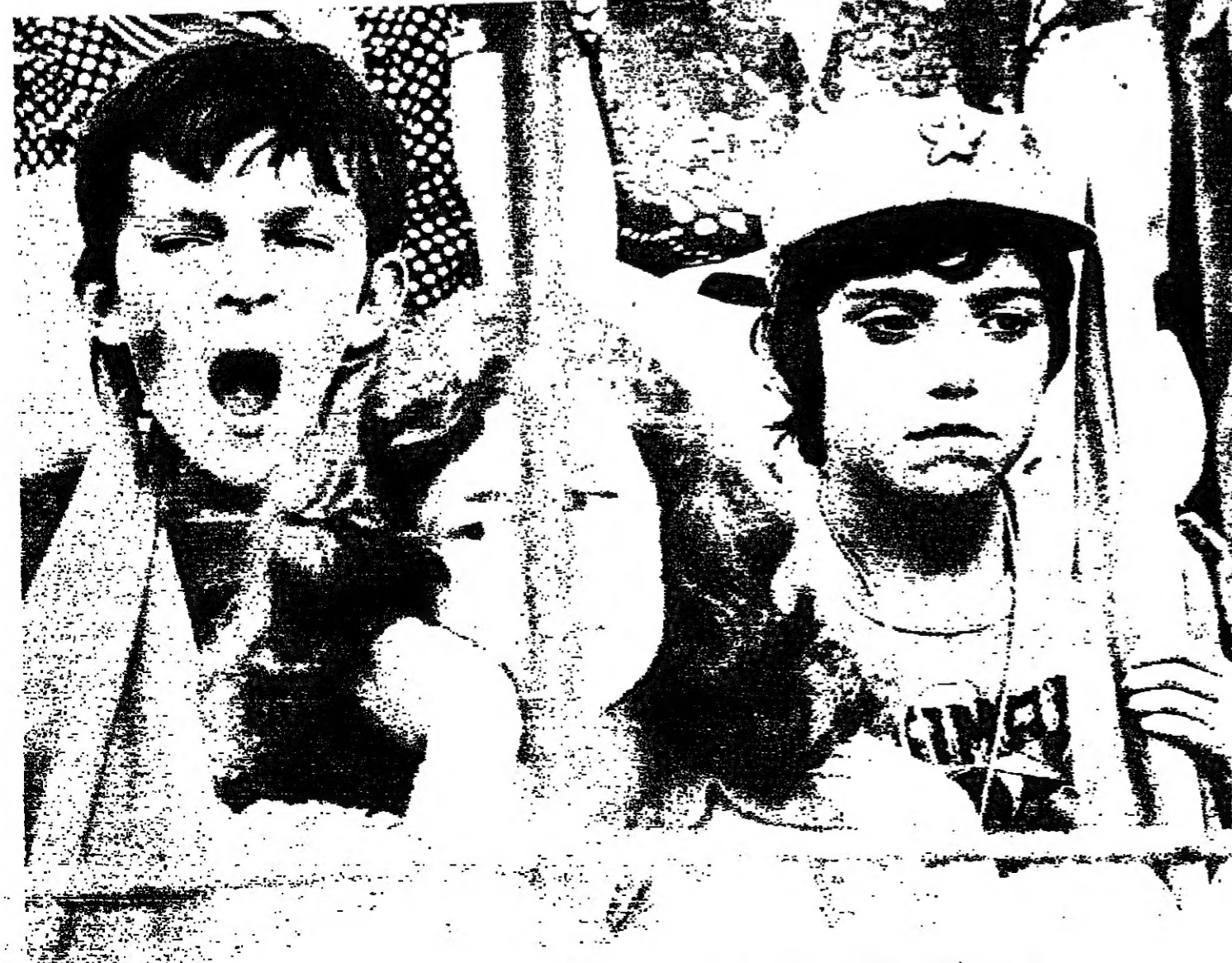
■ وجوه اطفال برتغاليين .. اهدم بنظر الى المعين ، والاخرت يد التوم الى جنونه